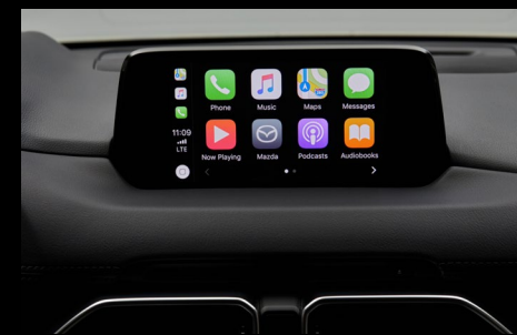
Apple Carplay vejl. udsalgspris kr. 3.295,-