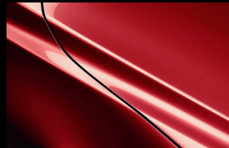
Metallakering fra kr. 5.500,- til kr. 9.200,-